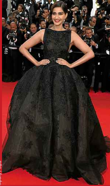
Sipany / Sipa