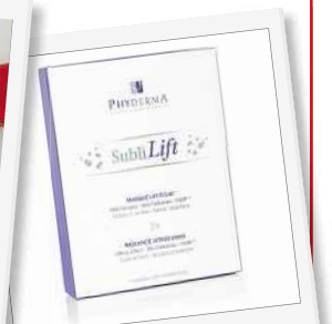
Le masque Lift Eclat de Phyderma est à base d'actifs naturels.