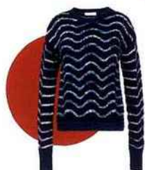
Pull en cachemire, Jil Sander , 1778 €. fartetch.com