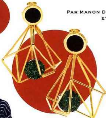
Pendants d'oreilles en métal doré et corne, Marni , 460 €. marni.com