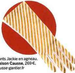
Gants Jackie en agneau, Maison Causse , 269 €. causse-gantier.fr