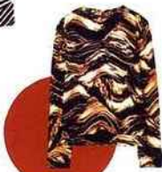
Sweatshirt en coton et jersey, Cos , 55 €. cosstores.com