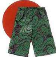
Short en laine et tweed, Acne Studios , prix sur demande. acnestudios.com