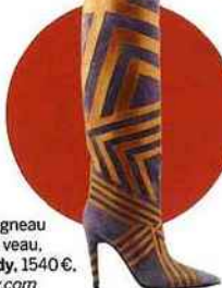
Bottes en agneau retourné et veau, Pierre Hardy , 1540 €. pierrehardy.com