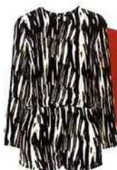
Combi-short en polyester, Topshop , 76 €. topshop.com