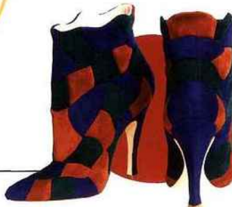
Bottines patchwork en veau velours doublé chèvre, Vincent [Bottes] , 1080 €. vincentbottes.com