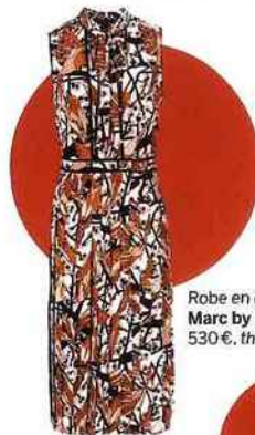
Robe en crêpe de soie, Marc by Marc Jacobs , 530 €. thecorner.com

PAR MANON DEL COLLE, RÉMI DUCHEIX-TROLEZ ET FLORIANE REYNAUD