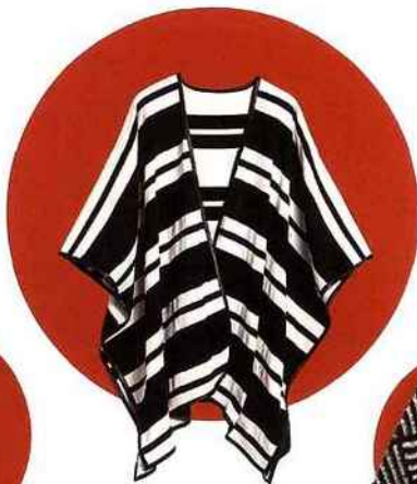
Cape en polyester, H&M , 34,99 €. hm.com