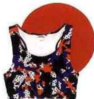
Brassière en coton, Monki , 10 €. monki.com