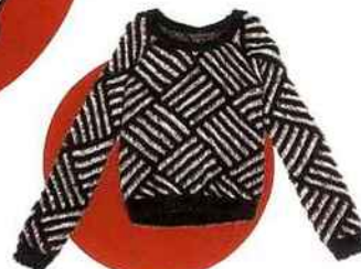
Pull en coton, Best Mountain , 69.90 €. best-mountain.com