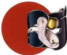
Bracelet en métal finition or, palladium et cristaux verts facetés "Men in Dior", Dior , 1390 €. dior.com