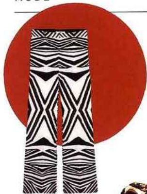
Pantalon en Lycra et viscose, LIL , 320 €. lilparis.com